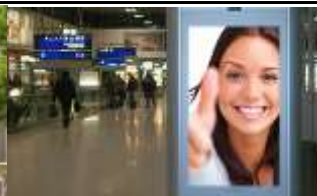
4020, Linz, Bahnhof 315.000K / Wo, 0,5m 2 / stnr: 303