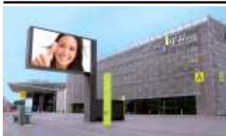
8020, Graz Messeplatz 630.000K / Wo, 40m 2 / stnr: 713