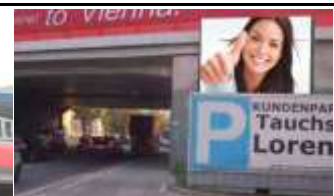
1100, Triester Straße 350.000 K / Wo, 6m 2 / stnr: 106