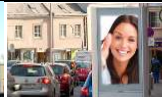
3400, Klosterneuburg 175.000K / Wo, 0,5m 2 / stnr: 203