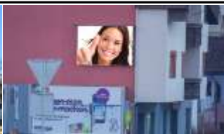
6410, Telfs 175.000K / Wo, 6m 2 / stnr: 814