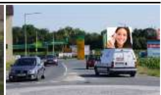
8430, Leibnitz, Ortseinfahrt 196.000K / Wo, 12m 2 / stnr: 721