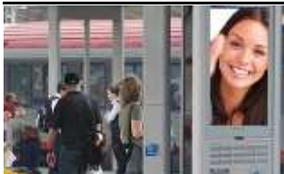
1120, Bahnhof Meidling 175.000 K / Wo, 0,5m 2 / stnr: 124