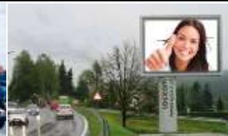
9620, Hermagor 112.000K / Wo, 7,7m 2 / stnr: 428