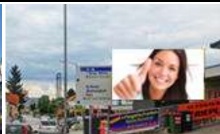
8020, Graz, Liebenauer Hauptstr. 315.000K / Wo, 12m 2 / stnr: 710