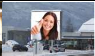
5582, Sankt Michael 84.000K / Wo, 9m 2 / stnr: 604