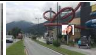
6300, Wörgl, Wasserwelten 35.000K / Wo, 11m 2 / stnr: 812