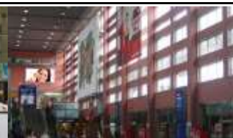
6020, Innsbruck, BH 266.000K / Wo, 5,4m 2 / stnr: 808