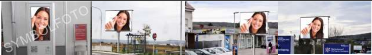
7000, Eisenstadt, Bahnhof 84.000K / Wo, 0,5m 2 / stnr: 501