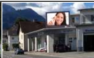
9620, Hermagor, Gaital Str. 59.500K / Wo, 12m 2 / stnr: 430