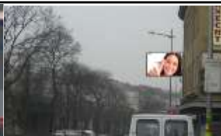
1150, Neubaugürtel 1.750.000 Kontakte/Woche, 6m 2