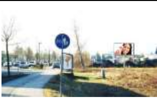
6850, Dornbirn Nord 210.000K / Wo, 12m 2 / stnr:906