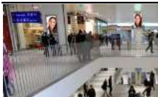
1150, Westbahnhof Bahnsteig 350.000 K / Wo, 0,5m 2 / stnr: 119