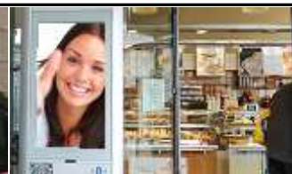
2700, Wiener Neustadt 175.000K / Wo, 0,5m 2 / stnr: 215