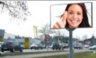
6871, Hard 119.000K / Wo, 10m 2 / stnr: 909