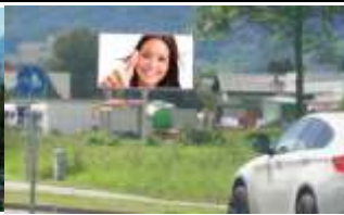
6850, Dornbirn bei ÖAMTC 119.000K / Wo, 10m 2 / stnr: 903