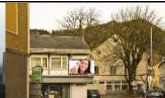
4580 Windischgarsten 84.000K / Wo, 6m 2 / stnr: 312