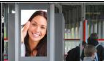
1210, BH Floridsdorf 455.000 K / Wo, 0,5m 2 / stnr: 118