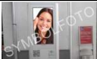
7350, Oberpullendorf 49.000K / Wo, 0,5m 2 / stnr: 509