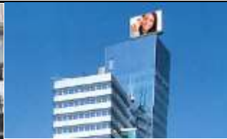
1020, News Tower 560.000 K / Wo, 70m 2 / stnr: 104