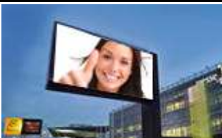
8020, Graz, Messe Graz 315.000K / Wo, 12m 2 / stnr: 709