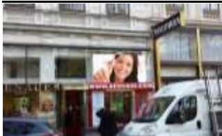
1010, Opernring 350.000 K / Wo, 4,5m 2 / stnr: 102