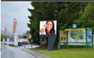
5500, Bischofshofen 42.000K / Wo, 6m 2 / stnr: 601