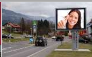
9811, Lendorf bei Spittal 168.000K / Wo, 7,7m 2 / stnr: 434