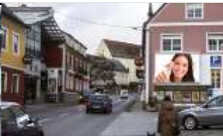
8224, Kaindorf 84.000K / Wo, 12m 2 / stnr: 719