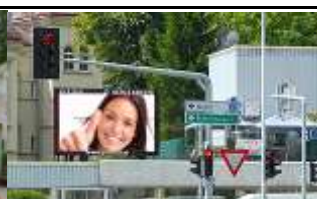
4400, Steyr, Taborknoten 245.000K / Wo, 12m 2 / stnr: 307