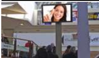
6176, Völs 105.000K / Wo, 5m 2 / stnr: 809