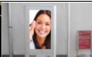
3500, Krems 175.000K / Wo, 0,5m 2 / stnr: 206