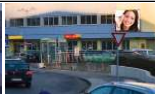
6460, Imst Postamt 98.000K / Wo, 12m 2 / stnr: 815