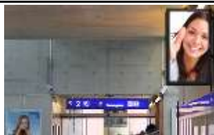
2500, Baden 175.000K / Wo, 0,5m 2 / stnr: 202