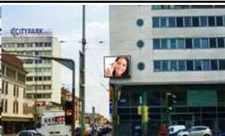
8020, Graz, Bahnhofgürtel 686.000K / Wo, 12m 2 / stnr: 706