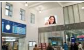
3100, St. Pölten, Bahnhof 182.000K / Wo, 12m 2 / stnr: 211