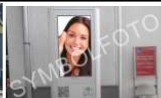
6300, Wörgl, Bahnhof 42.000K / Wo, 0,5m 2 / stnr: 811