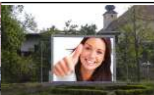
8502, Lannach 70.000K / Wo, 12m 2 / stnr: 720