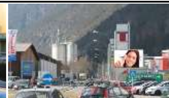
6460, Imst Kaufpark 350.000K / Wo, 14m 2 / stnr: 816