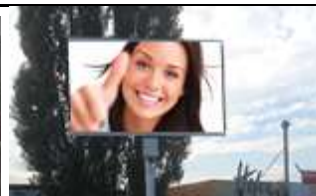
8330, Mühldorf 38.000K / Wo, 10m 2 / stnr: 723