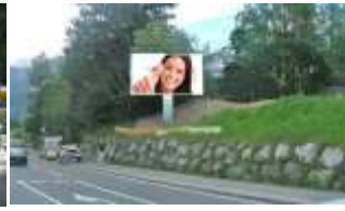
5760, Saalfelden Süd 119.000K / Wo, 15m 2 / stnr: 607