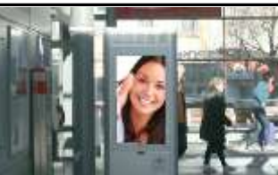
2632, St. Valentin 175.000K / Wo, 0,5m 2 / stnr: 213