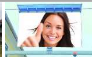
9330, Althofen 63.000K / Wo, 10m 2 / stnr: 435