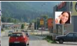
6300, Wörgl, EKZ 140.000K / Wo, 8m 2 / stnr: 810