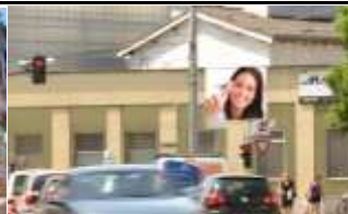
4020, Linz, Unionstraße 245.000K / Wo, 7m 2 / stnr: 302