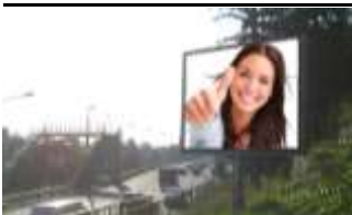
3400, Klosterneuburg 280.000K / Wo, 12m 2 / stnr: 204