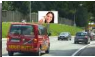
5760, Saalfelden Nord 119.000K / Wo, 15m 2 / stnr: 606