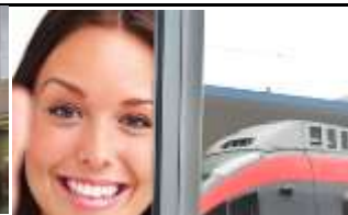
1100, Hauptbahnhof 1.015.000 K /Wo 0,5m 2 / stnr: 126