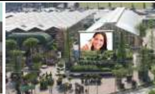
6020, Innsbruck, DEZ (EKZ) 588.000K / Wo, 15m 2 / stnr: 803