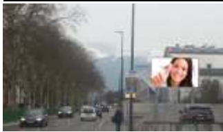
6020, Innsbruck bei Flughafen 186.000K / Wo, 10m 2 / stnr: 801