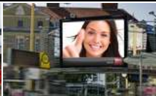
8020, Graz, Jakominiplatz 560.000K / Wo, 12m 2 / stnr: 711