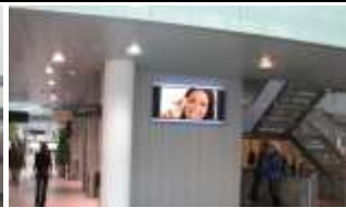
6020, Innsbruck, Anichstr. 140.000K / Wo, 1m 2 / stnr: 802