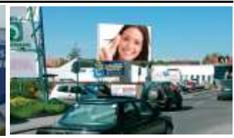
8200, Gleisdorf 210.000K / Wo, 12m 2 / stnr: 704