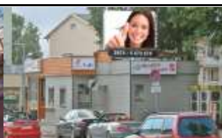
4240, Freistadt 189.000K / Wo, 6,5m 2 / stnr: 306