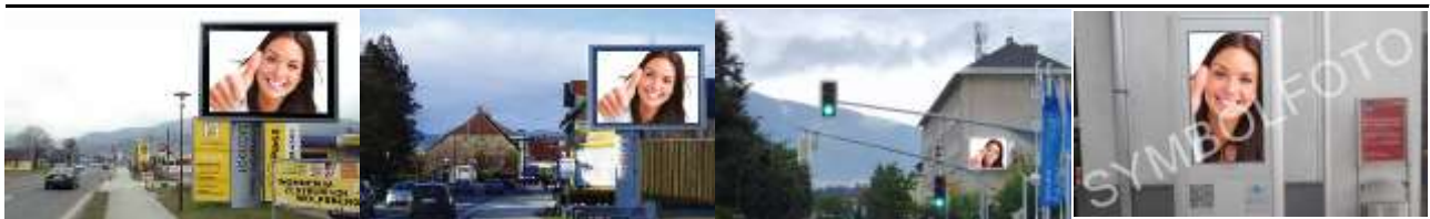
9400, Wolfsberg Süd 105.000K / Wo, 7,7m 2 / stnr: 417