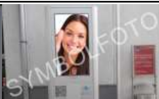
3423, St. Andrä Wördern 175.000K / Wo, 0,5m 2 / stnr: 207