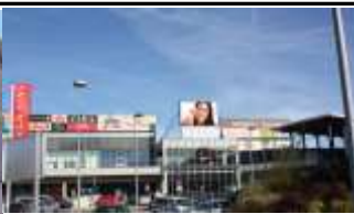
8020, Graz, Shopping City Parkplatz 595.000K / Wo, 20m 2 / stnr: 714