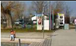
7400, Oberwart 49.000K / Wo, 0,5m 2 / stnr: 510