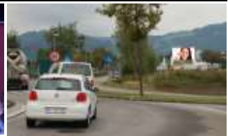
6870, Lustenau 119.000K / Wo, 10m 2 / stnr:908