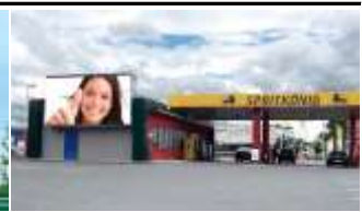
8020, Graz, Triester Straße 245.000K / Wo, 23m 2 / stnr: 716