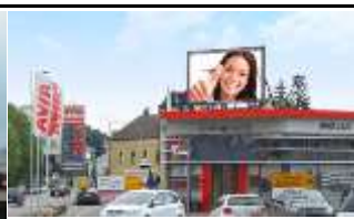
4910, Ried im Innkreis 112.000K / Wo, 6m 2 / stnr: 318