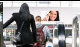
4020, Linz, Bahnhof 252.000K / Wo, 9,5m 2 / stnr: 304