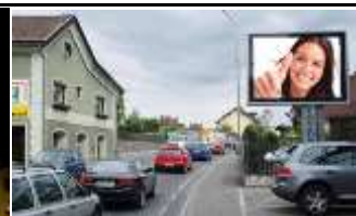
9800, Spittal, Mitte 119.000K / Wo, 7,7m 2 / stnr: 432