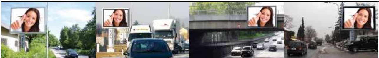
9020, Klagenfurt Viktring 182.000K / Wo, 7,7m 2 / stnr: 405