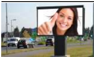
8430, Leibnitz, Leopold Figl Str. 140.000K / Wo, 12m 2 / stnr: 721