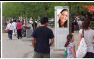
7100, Neusiedl am See 49.000K / Wo, 0,5m 2 / stnr: 507