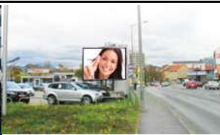
8020, Graz, AUDI Zentrum 630.000K / Wo, 12m 2 / stnr: 707