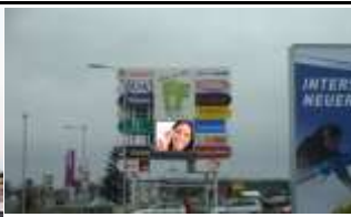
8280, Fürstenfeld, Ortseinfahrt 87.500K / Wo, 12m 2 / stnr: 703