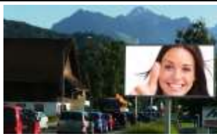
6800, Feldkirch Königshofstr. 119.000K / Wo, 10m 2 / stnr: 902