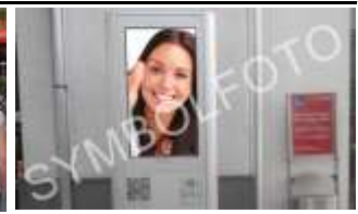
7210, Mattersburg 49.000K / Wo, 0,5m 2 / stnr: 508