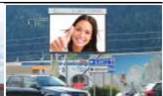
8900, Liezen 280.000K / Wo, 9m 2 / stnr: 724