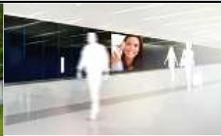
5020, Salzburg 252.000K / Wo, 6m 2 / stnr: 602