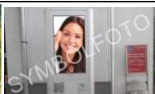
6580, St. Anton 35.000K / Wo, 0,5m 2 / stnr: 818