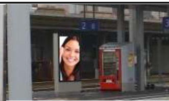
4800, Attnang Puchheim 105.000K / Wo, 0,5m 2 / stnr: 316