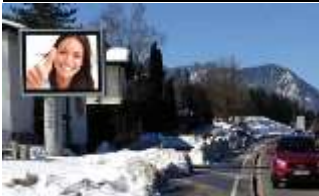
9500, Villach, West 133.000K / Wo, 7,7m 2 / stnr: 425