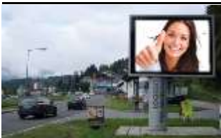
9620, Hermagor, Ost 105.000K / Wo, 7,7m 2 / stnr: 429