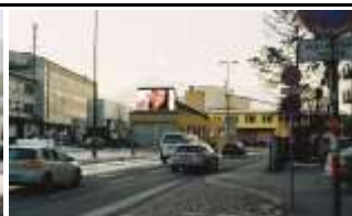
6020, Innsbruck Olympiastr. 427.000K / Wo, 15m 2 / stnr: 806