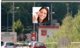
6500, Landeck 245.000K / Wo, 9m 2 / stnr: 817