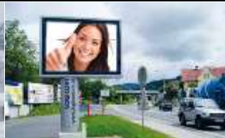
9560, Feldkirchen 189.000K / Wo, 7,7m 2 / stnr: 427