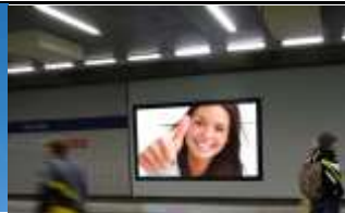
1030, Bahnhof Wien Mitte 378.000 K / Wo, 15m 2 / stnr: 109