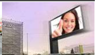
8020, Graz, Messe Graz 315.000K / Wo, 12m 2 / stnr: 708