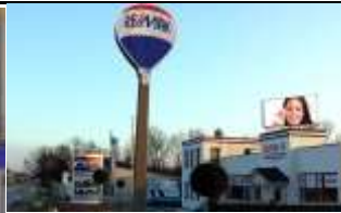
2483, Ebreichsdorf 84.000K / Wo, 7m 2 / stnr: 216