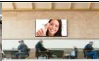
1150, Westbahnhof Haupthalle 525.000 K / Wo, 9,5m 2 / stnr: 103