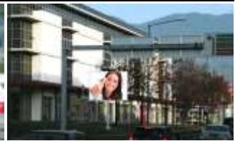
6850, Dornbirn Messepark 210.000K / Wo, 13m 2 / stnr: 904