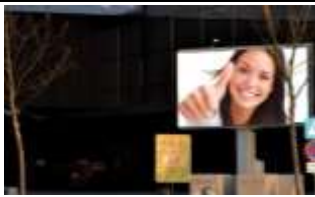
6850, Dornbirn Messe 210.000K / Wo, 9m 2 / stnr:905