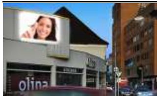
4400, Steyr, Zentrum 119.000K / Wo, 7m 2 / stnr: 309