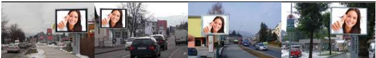
9020, Klagenfurt St. Veiter Str. 210.000K / Wo, 7,7m 2 / stnr: 409