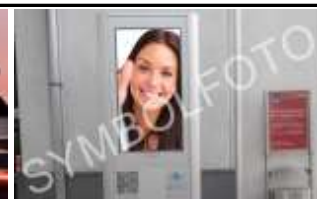
4600, Wels, Bahnhof 164.000K / Wo, 12m 2 / stnr: 315