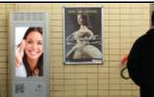
3364, Korneuburg 175.000K / Wo, 0,5m 2 / stnr: 205