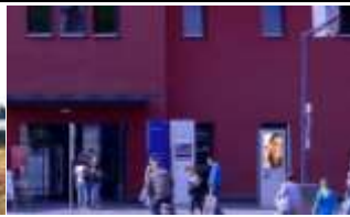
6850, Dornbirn, Bahnhof 35.000K / Wo, 0,5m 2 / stnr:907