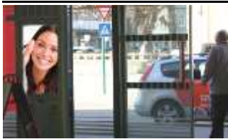
3300, Amstetten 175.000K / Wo, 0,5m 2 / stnr: 201