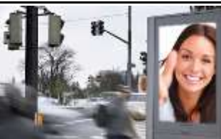
2340, Mödling 175.000K / Wo, 0,5m 2 / stnr: 209