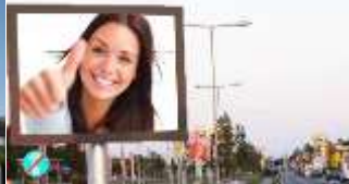
8280, Fürstenfeld, Teubl Werbeturm 105.000K / Wo, 12m 2 / stnr: 702