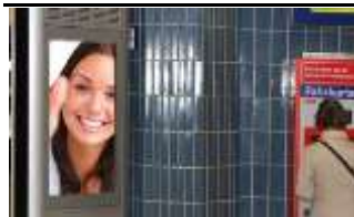
1090, Franz-Josefs-Bahnhof 175.000 K / Wo, 0,5m 2 / stnr: 121