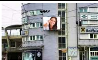
8020, Graz, Stadionturm 224.000K / Wo, 12m 2 / stnr: 705