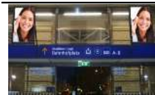
3100, St. Pölten, Bahnhof 175.000K / Wo, 0,5m 2 / stnr: 212