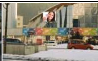
6020, Innsbruck Innsbrucker Str. 420.000K / Wo, 15m 2 / stnr: 807