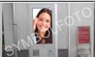
3442, Langenrohr 175.000K / Wo, 0,5m 2 / stnr: 207