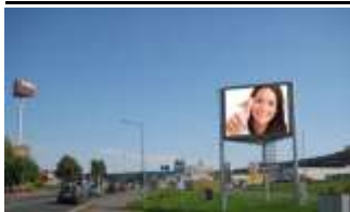
8330, Feldbach 105.000K / Wo, 12m 2 / stnr: 701