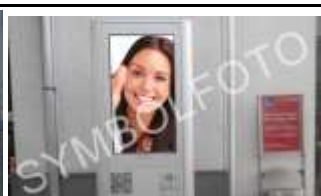
8700, Leoben 35.000K / Wo, 0,5m 2 / stnr: 722