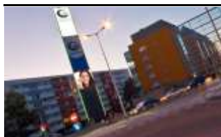
4030, Linz, Meixnerkreuzung 154.000K / Wo, 14m 2 / stnr: 305