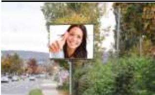
7000, Eisenstadt, Ruster Str. 84.000K / Wo, 12m 2 / stnr: 505