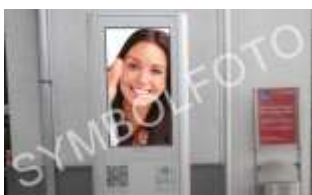
5700, Zell am See 35.000K / Wo, 0,5m 2 / stnr: 605