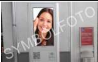
6800, Feldkirch Bahnhof 35.000K / Wo, 0,5m 2 / stnr: 901