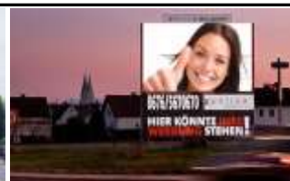
4600, Wels, Zentrum 164.000K / Wo, 12m 2 / stnr: 314