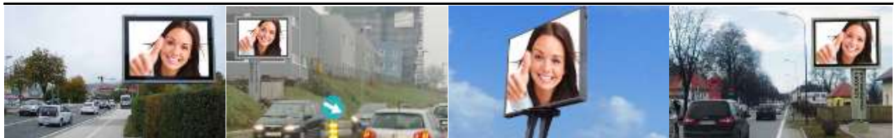
9300, St.Veit, Völkermarkter Str. 119.000K / Wo, 7,7m 2 / stnr: 413