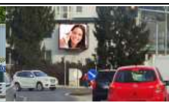
4400, Steyr, Haratzmüllerstraße 203.000K / Wo, 8m 2 / stnr: 308