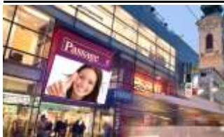
4020, Linz, Passage 280.000K / Wo, 12m 2 / stnr: 301