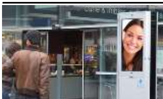
8020, Graz, Bahnhof 140.000K / Wo, 0,5m 2 / stnr: 717