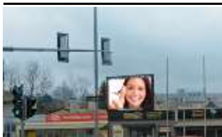
4840, Vöcklabruck 175.000K / Wo, 15m 2 / stnr: 317