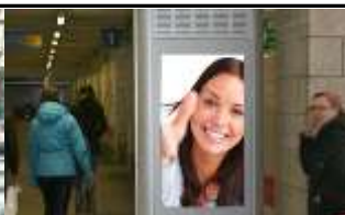
3430, Tulln 175.000K / Wo, 0,5m 2 / stnr: 214