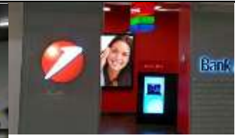
1030, Wien Mitte/THE MALL 350.000 K / Wo, 5m 2 / stnr: 116