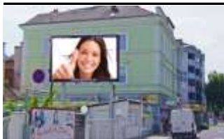
4600, Wels, Bahnhofstraße 245.000K / Wo, 12m 2 / stnr: 313