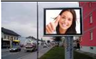
9800, Spittal, Ost 126.000K / Wo, 7,7m 2 / stnr: 433