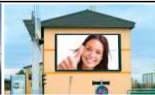
8020, Graz, Shopping City Einfahrt 315.000K / Wo, 35m 2 / stnr: 715