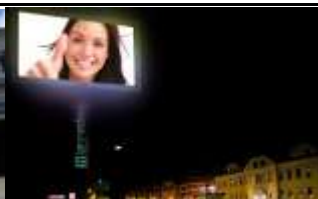
9640, Kötschach-Mauthen 59.500K / Wo, 8m 2 / stnr: 431