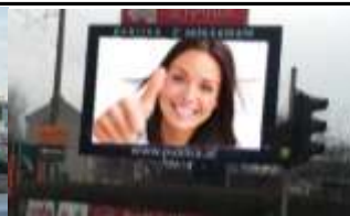
4560, Kirchdorf an der Krems 91.000K / Wo, 7m 2 / stnr: 311