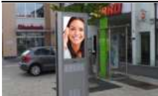
2340 BH Mödling 175.000K / Wo, 0,5m 2 / stnr: 208