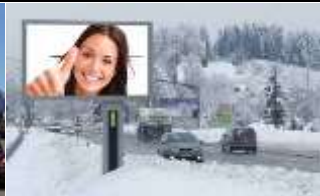
9500, Villach, EKZ West 133.000K / Wo, 7,7m 2 / stnr: 426