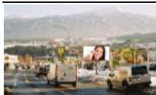
6020, Innsbruck bei ÖAMTC 301.000K / Wo, 10m 2 / stnr: 805