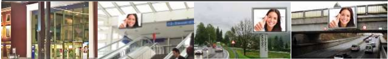
9020, Klagenfurt, Bahnhof 49.000K / Wo, 0,5m 2 / stnr: 401