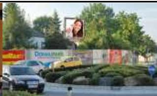
4470, Enns 147.000K / Wo, 8m 2 / stnr: 310