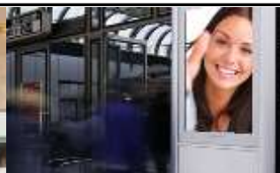
1190, Bahnhof Heiligenstadt 175.000 K / Wo, 0,5m 2 / stnr: 123