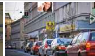
1150, Mariahilfer Straße 245.000 K / Wo, 6m 2 / stnr: 105