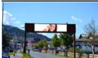
6365, Kirchberg 35.000K / Wo, 7,4m 2 / stnr: 813