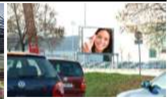
8020, Graz Weblinger Gürtel 245.000K / Wo, 12m 2 / stnr: 712