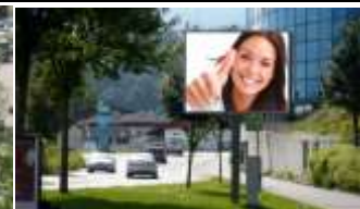
6020, Innsbruck, DEZ (EKZ) 588.000K / Wo, 8m 2 / stnr: 804