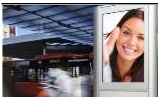
1230, Bahnhof Liesing 175.000 K / Wo, 0,5m 2 / stnr: 122