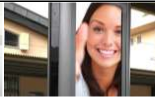
5754, Schwarzach 49.000K / Wo, 0,5m 2 / stnr: 603